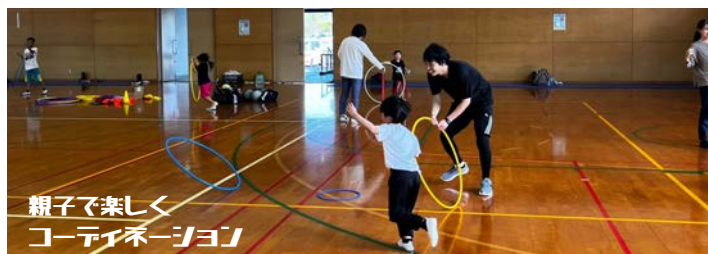
親子で楽しく コーディネーション